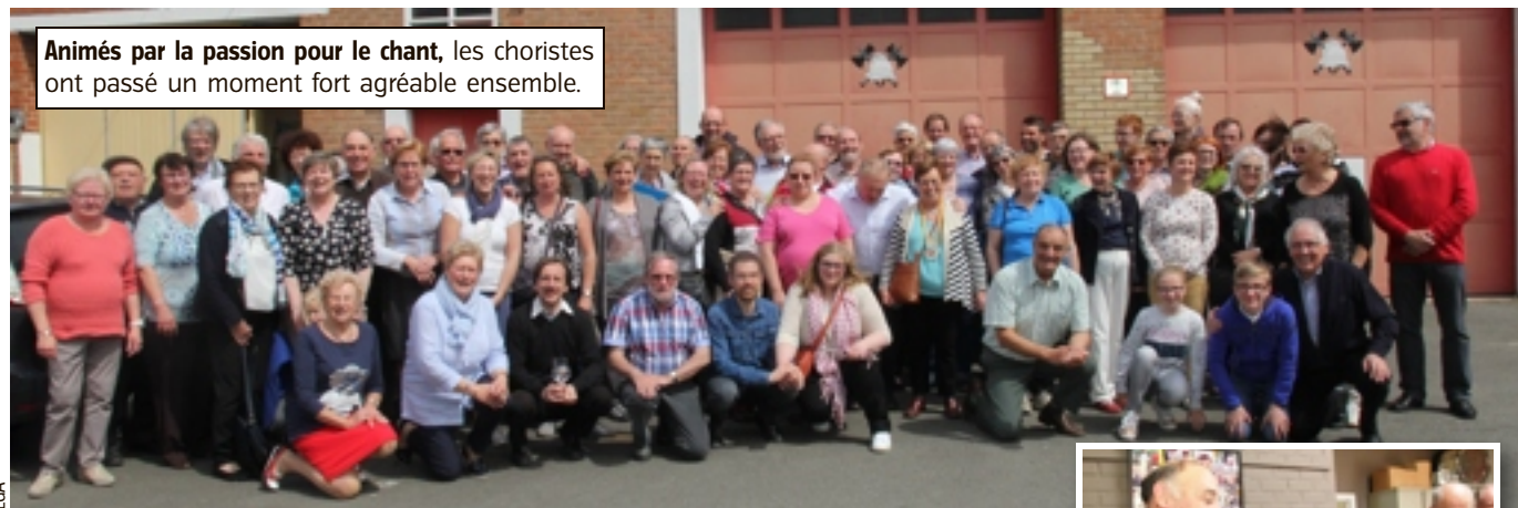
Animés par la passion pour le chant, les choristes ont passé un moment fort agréable ensemble.

Nos joyeux Luxembourgeois ont pris leurs quartiers dans un gîte à Kemmel. Et, leurs journées ont été bien chargées en visites de sites historiques, du cimetière militaire britannique Tyne Cot, près de Passendale, à Poperinge, en passant par Ypres. Le dimanche a été consacré à la découverte du « pays d'Hélène ». En matinée, en compagnie de la guide Madeleine Deleu, ils ont parcouru le musée de la rubanerie, avant d'être accueillis à Ploegsteert sur l'heure de midi pour partager quelques verres et sandwiches, mais surtout pour